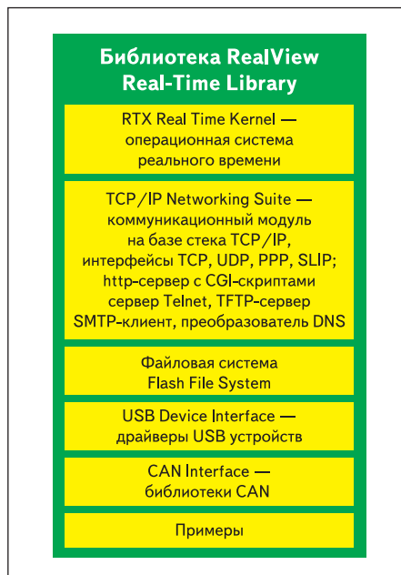
Рис. 1. Структура библиотеки RealView Real-Time Library

Операционная система реального времени позволяет сократить время разработки, создать надежную, расширяемую систему. Поскольку операционная система берет на себя выполнение части функций, упрощается логическая структура приложения. Использование Real-Time Kernel позволяет разработчику сконцентрироваться на создании приложения, а не на управлении ресурсами системы, составляя расписание переключения задач и расставляя приоритеты. Распределением ресурсов занимается сама операционная система. Real-Time Kernel представляет собой разделительный слой между программным обеспечением и аппаратной частью, что поз-