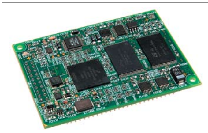
Рис. 4. Внешний вид модуля MCF5208

модулей SYSTEC является экономически выгодным при количествах от нескольких штук. Модули SYSTEC ускоряют реализацию проекта, позволяя уделять больше внимания аппаратной и программной части проекта, его тестированию и верификации. ■