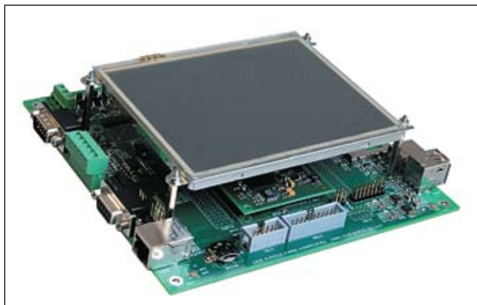
Рис. 1. Отладочная плата SYSTEC